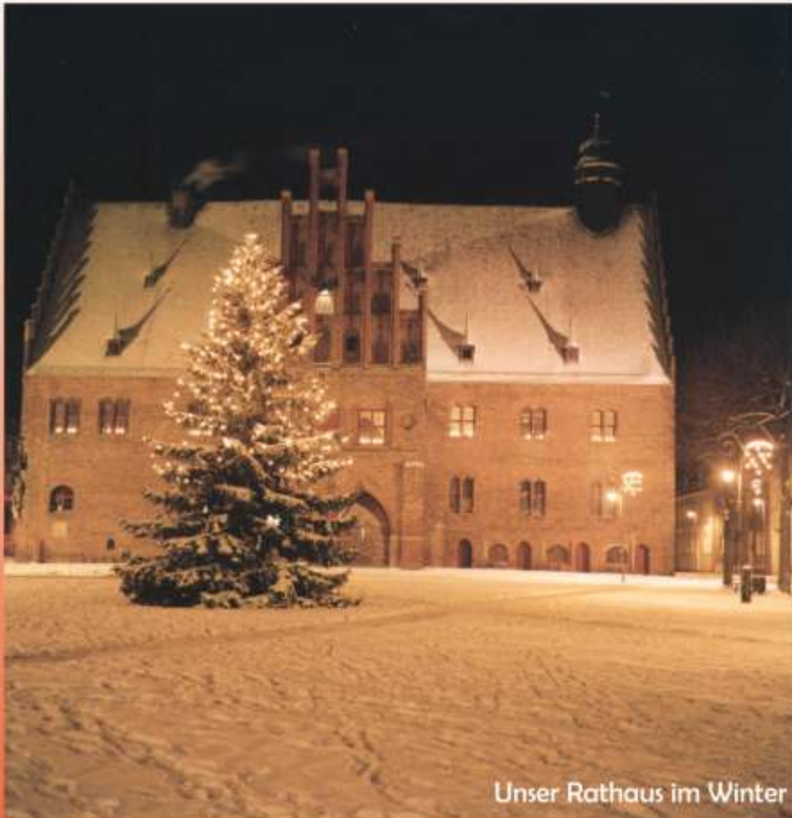
Unser Rathaus im Winter