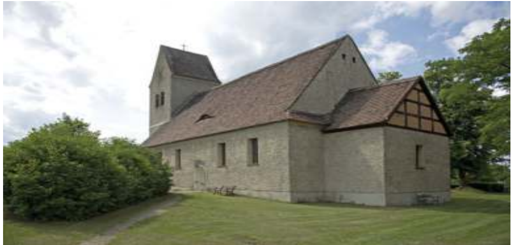
Dorfkirche Blankensee, Außenansicht

Im Innenraum der Kirche befindet sich der Kanzelaltar aus Holz, der aus dem frühen